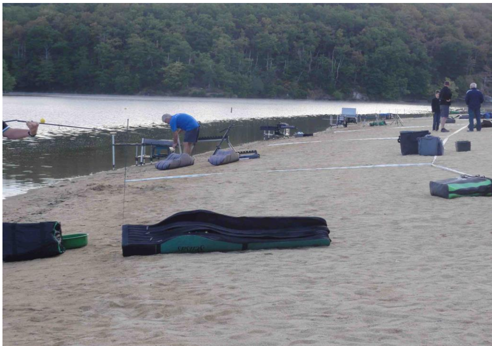
SECTEUR ANZEME PLAGE