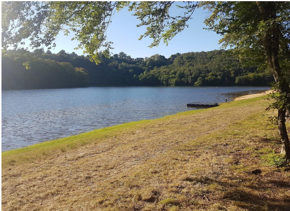
SECTEUR BOURG D'HEM