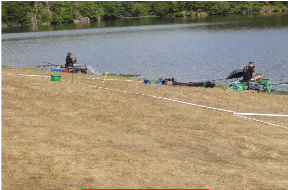
SECTEUR ANZEME PRE/BOIS