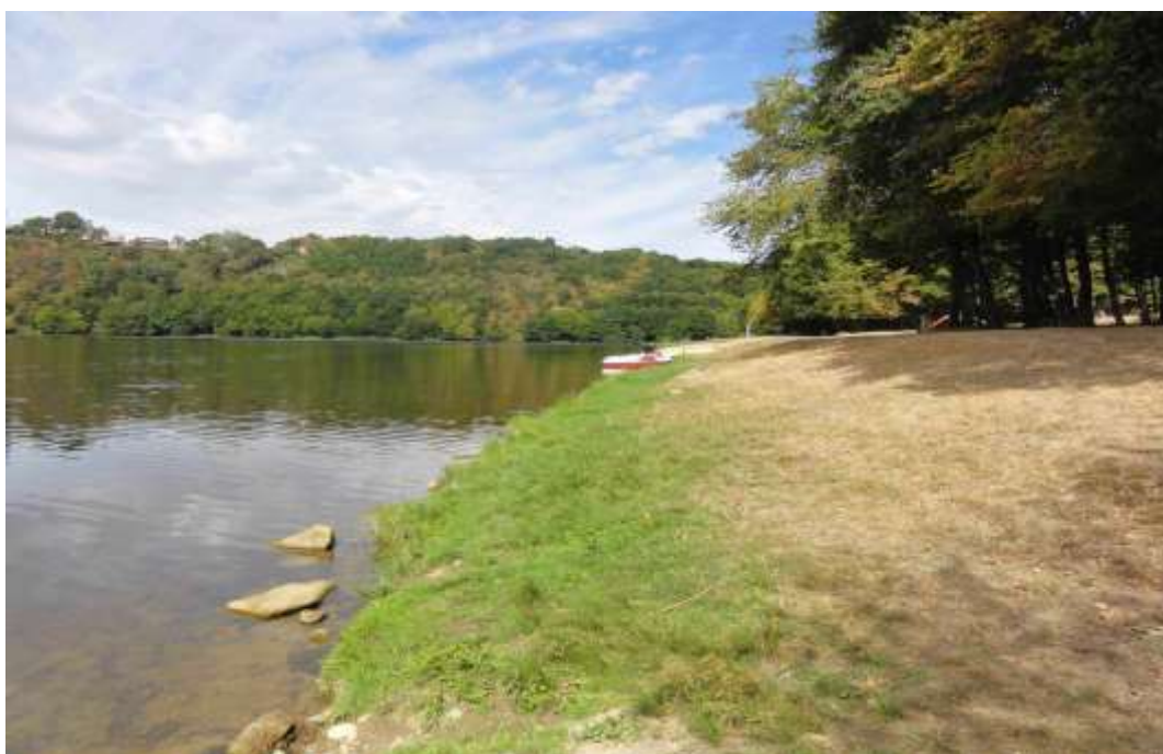
SECTEUR BOURG D'HEM (12 à 15 places)