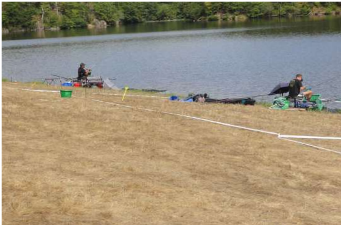
ANZEME SECTEUR PRE/BOIS (12 à 15 places)