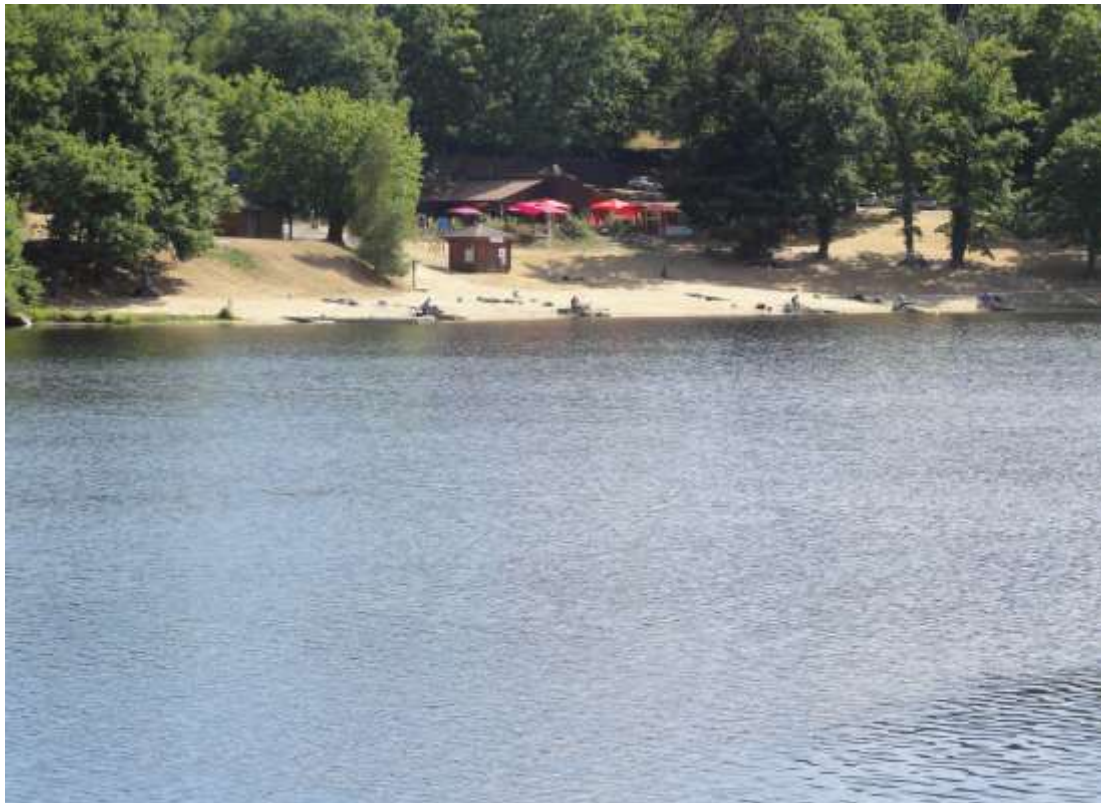
SECTEUR JOUILLAT (SECTEUR DE SECOURS. 12 à 15 places)