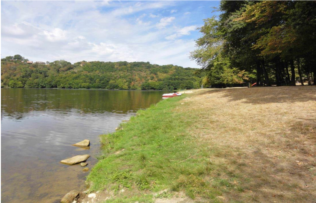
SECTEUR BOURG D'HEM (10/15 places)