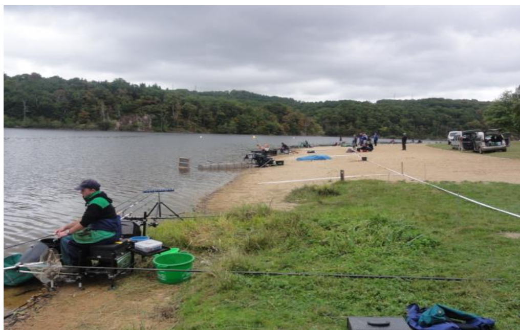
ANZEME SECTEUR PLAGE (10/15 places)