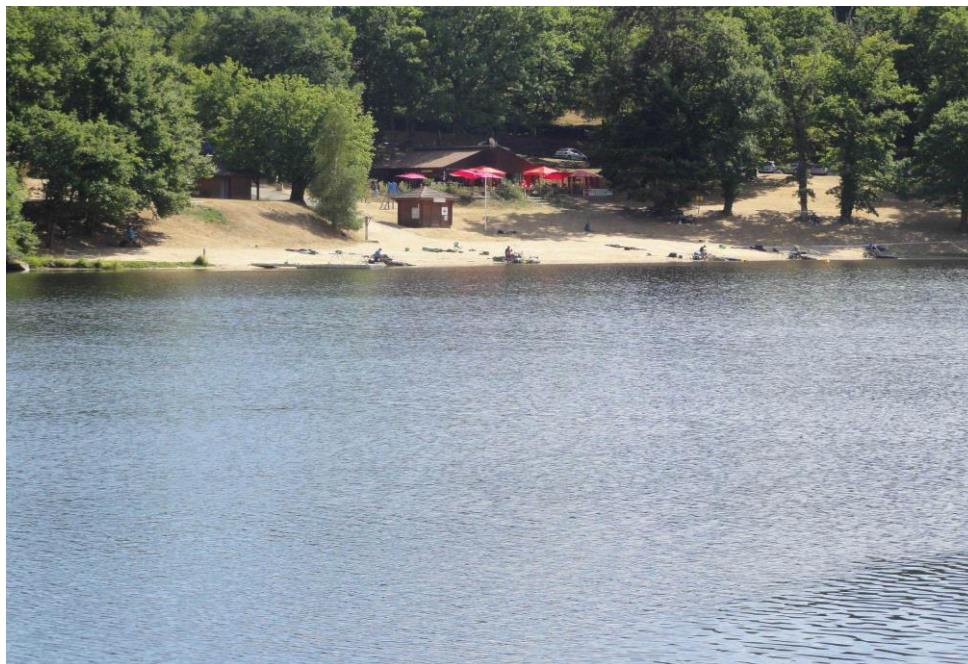
SECTEUR JOUILLAT (SECTEUR DE SECOURS. 9/10 places)

ATTENTION !!!! LE CHOIX DES SECTEURS SERA EFFECTUE EN FONCTION DU NOMBRE DE QUALILIES. VOUS SEREZ PREVENUS INDIVIDUELLEMENT