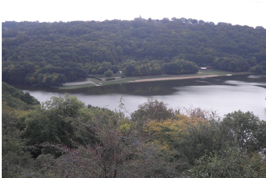
SECTEUR VERT. Plage Bourg d'Hem.