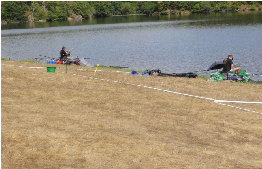
SECTEUR ROUGE. Pré/Bois